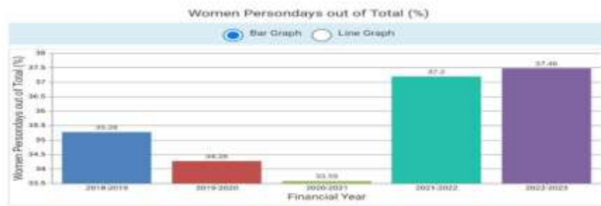
(चित्र : 3)