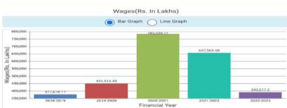
(चित्र : 4)