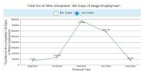
(चित्र : 1)